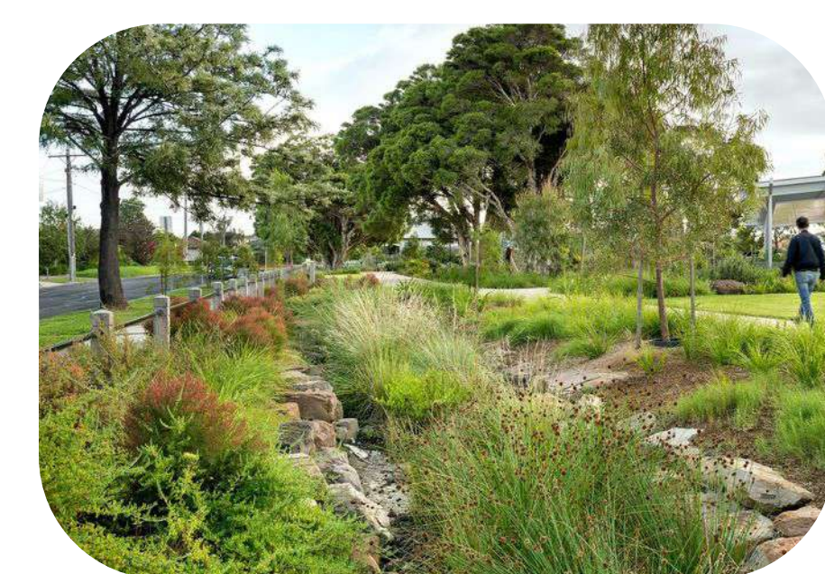
Waterberging in klimaatuin