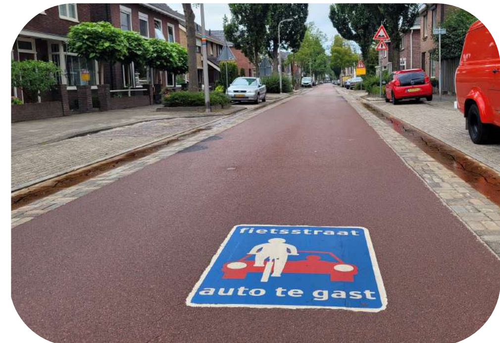
Fietsstraat t.p.v. uitrit parkeren

Overzichtelijke uitrit parkeren in samenspraak met Gemeente Haarlem