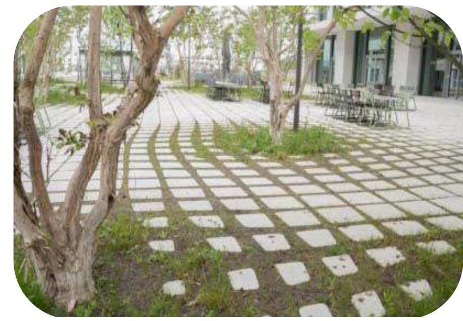
blending publieke en private ruimte