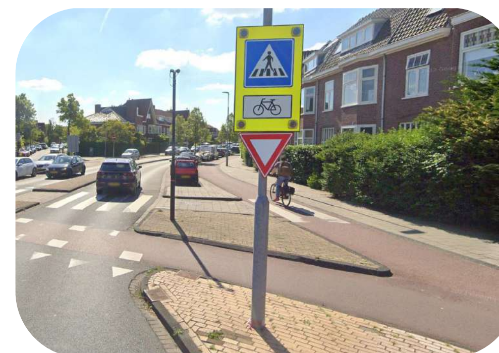
waarschuwborden naderende fietsers en voetgangers

Verkeersveiligheid voor langzaamverkeer heeft de hoogste prioriteit. Verkeerssituatie wordt uitgewerkt in samenspraak met Gemeente Haarlem