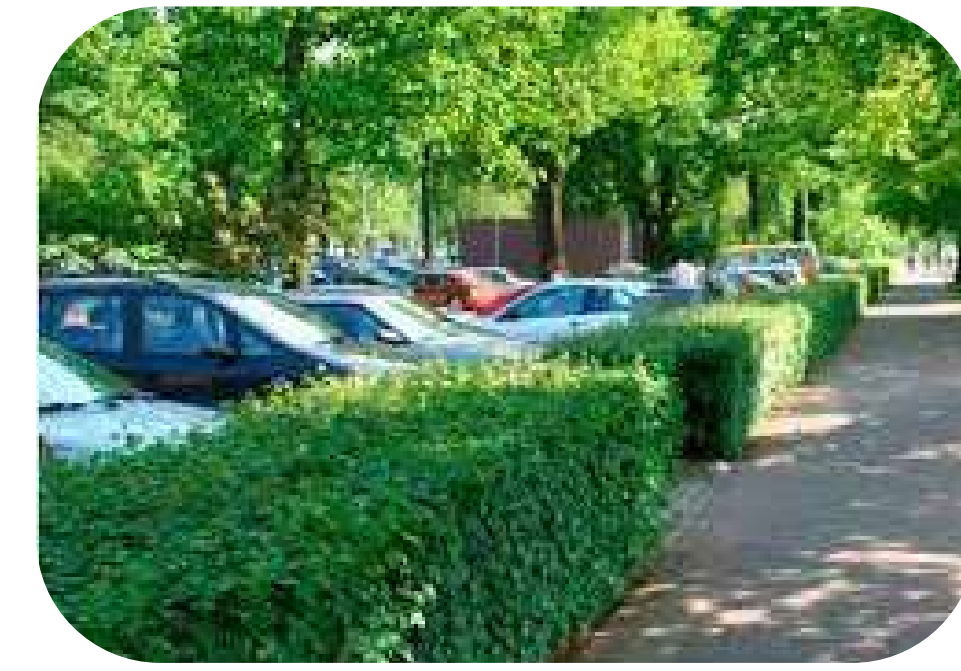
parkeren achter begroeiing