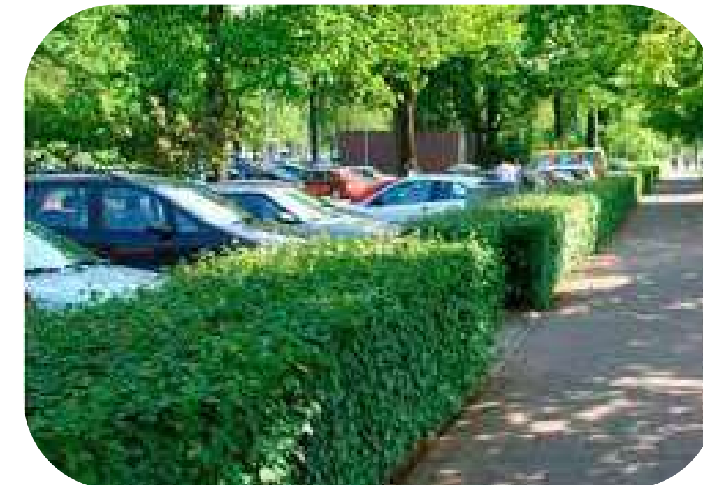
een groene haag onttrekt geparkeerde auto's aan het zicht

Alleen inrit om overlast van verlichting auto's te voorkomen