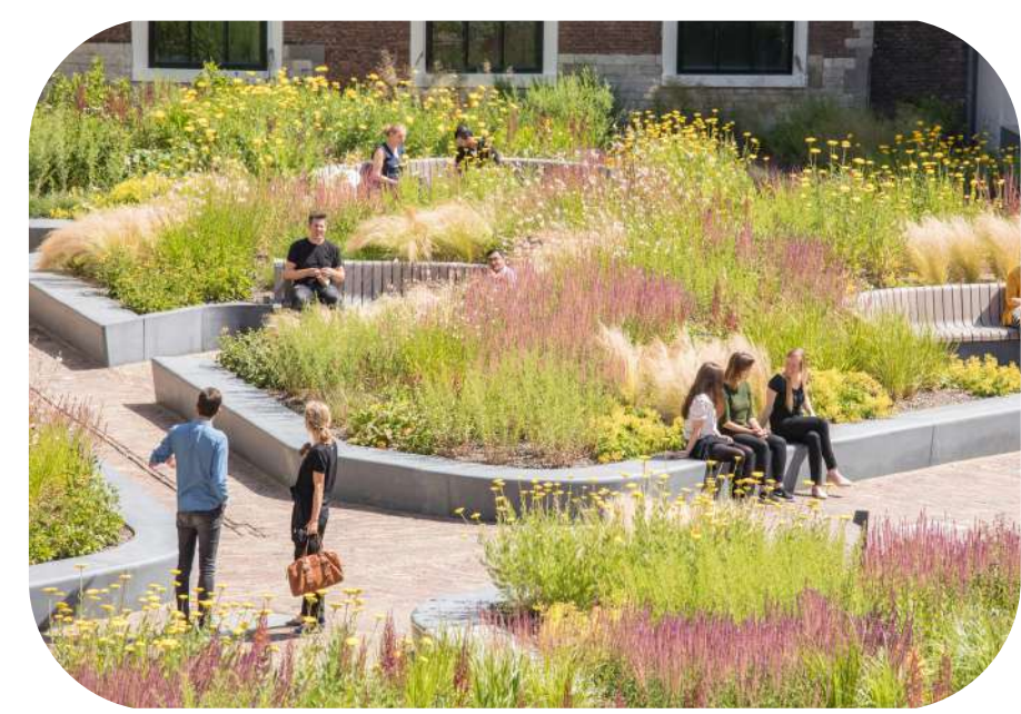
zitelementen in landschap